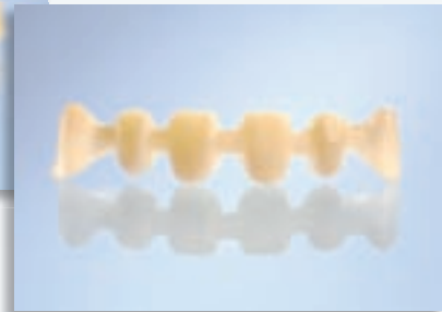
6-gliedrige Brücken 1