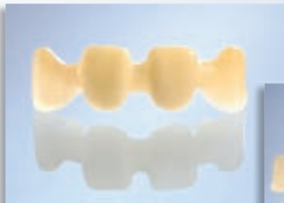
4-gliedrige Brücken 1