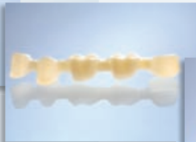
5-gliedrige Brücken 1