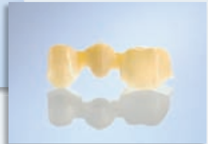
3-gliedrige Brücken 1