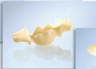
Inlay- und Onlaybrücken 2 (ausgenommen Bruxismus-Patienten)